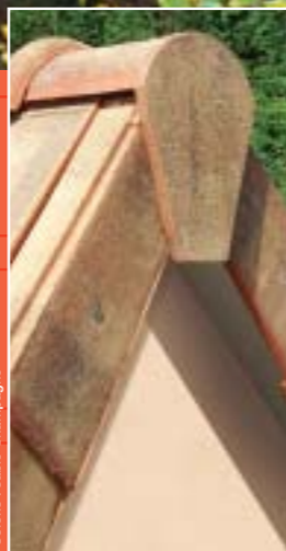
Coloris : sablé Champagne