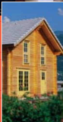
Coloris : vieilli lauze