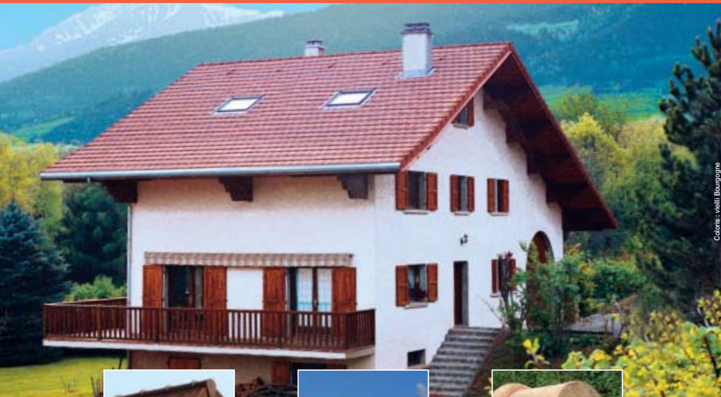
Coloris : vieilli Bourgogne