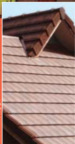
Coloris : vieilli Bourgogne